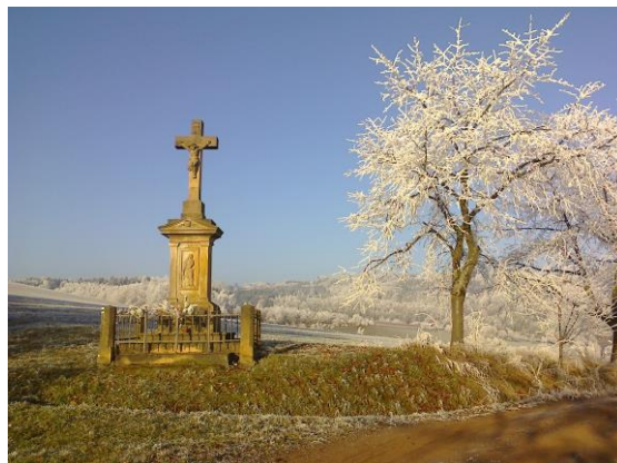
Krásy zimy – 1. leden 2017