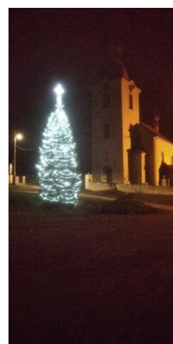
Vánoční strom 2020