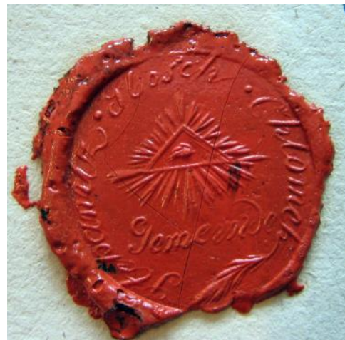
Pečet' obce Zboží