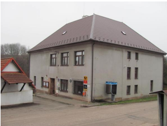
Budova obecního úřadu