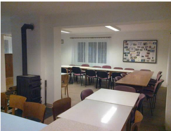
Klubovna hasičské zbrojnice v Úbislavicích