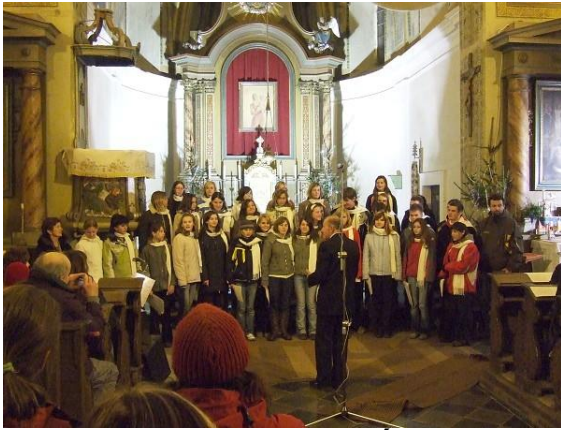
Vánoční zpívání v kostele v Úbislavicích