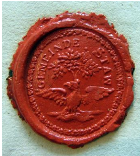
Pečet' obce Stav