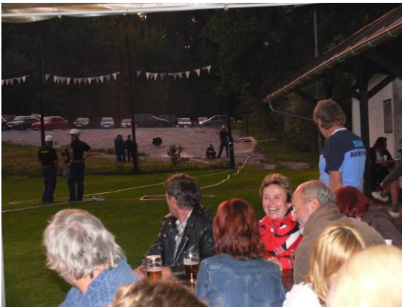
Noční soutěž hasičů