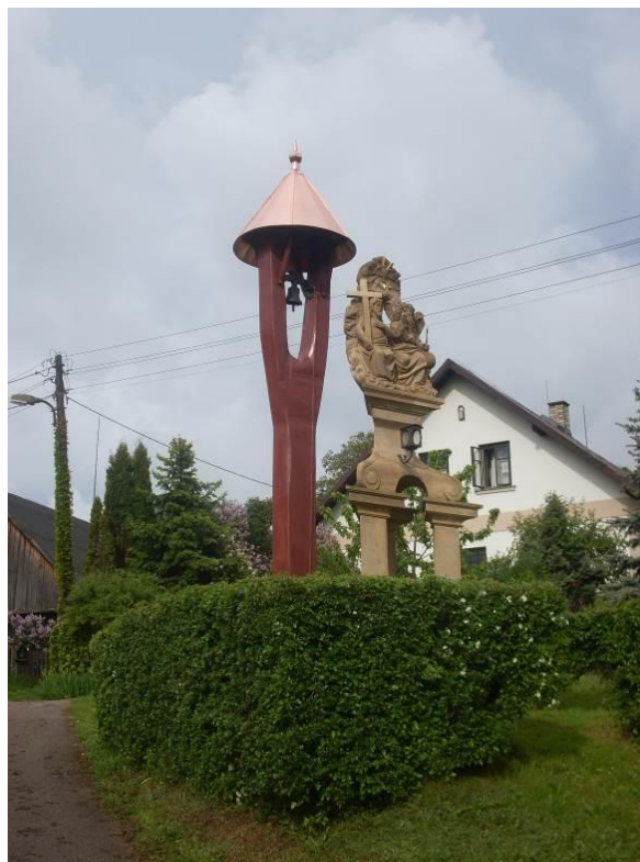
Zvonička v České Proseči