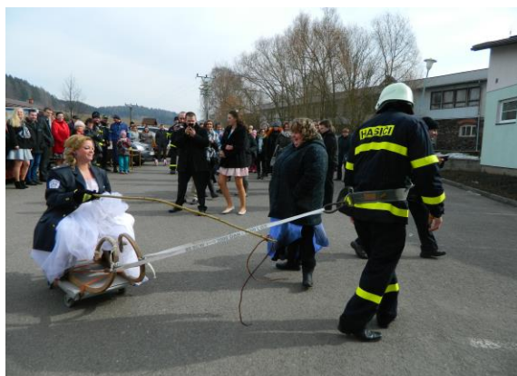
Svatba kolegy hasiče