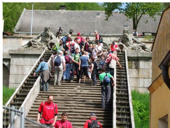
Výlet se Sokolem do Kuksu