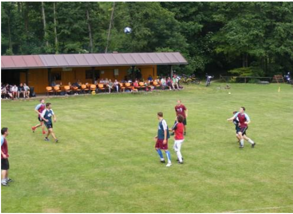
Podkumburský pohár v malé kopané