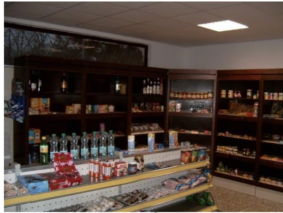
Prodejna v Úbislavicích