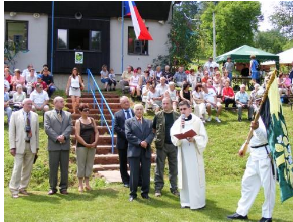
Oslavy 650 let trvání obce