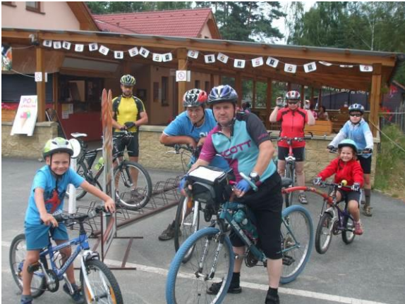
Společná dovolená hasičů v Jižních Čechách