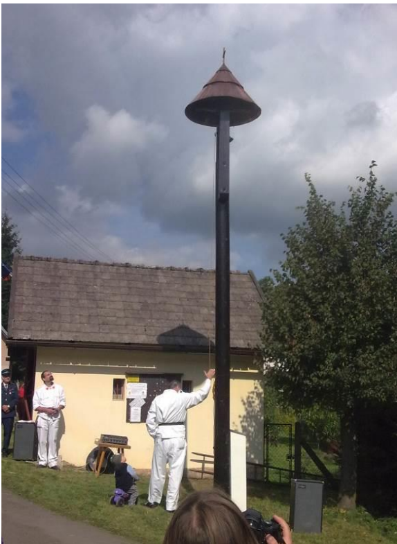
Zvonička ve Štěpanicích