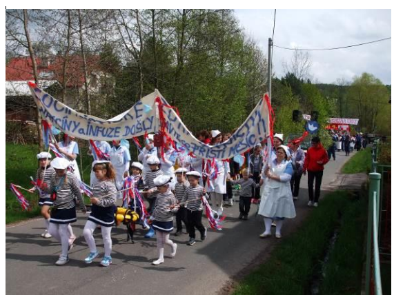
Recesistický 1.Máj v Úbislavicích