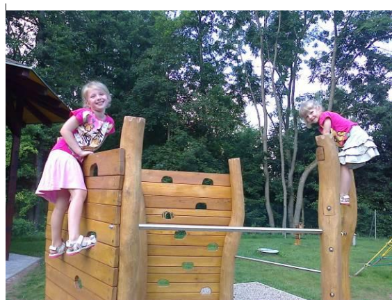
Dětský koutek na hřišti