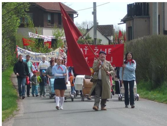
Recesistický 1. Máj 2015