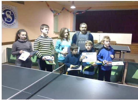
Turnaj ve stolním tenise