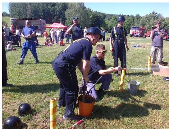
Oslavy 115. Let SDH Zboží 2019