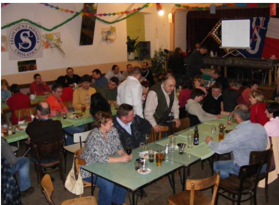
Výroční valná hromada TJ Sokol Úbislavice