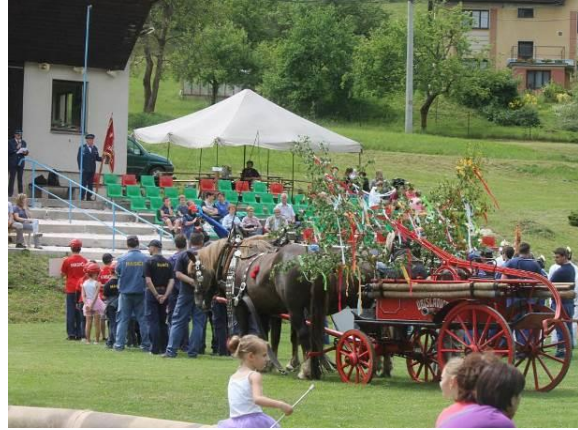
Oslavy 120. let úbislavických hasičů