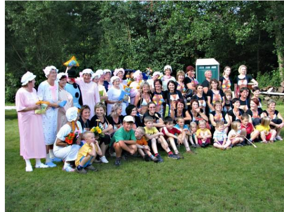
Cvičenci - Sokolské slavnosti