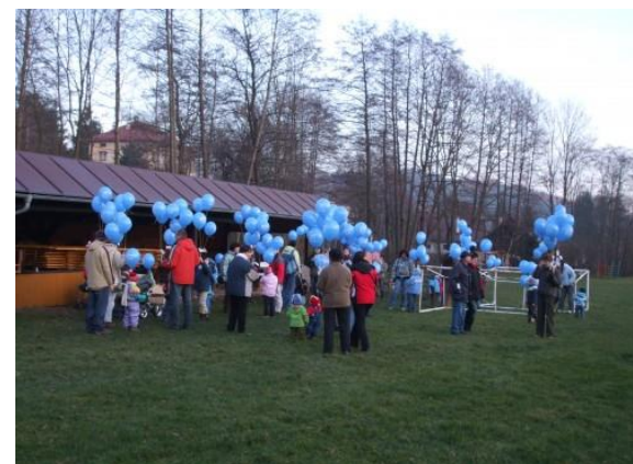
Vypouštění balónek Ježíškovi