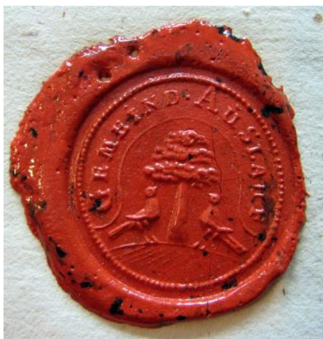
Pečet' obce Úbislavice