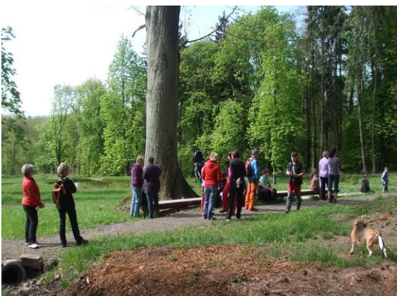
Výlet se Sokolem na Tábor