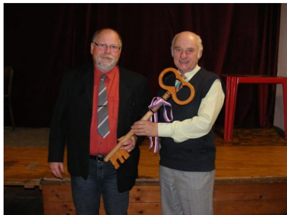
Předání symbolické klíče starostovi