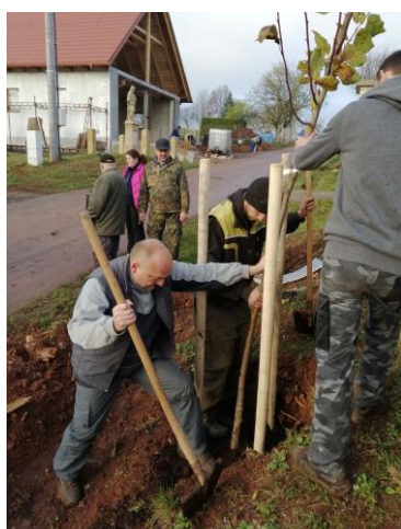
Sázení lip u hřbitova v Úbislavicích