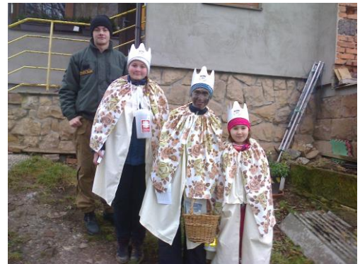
Skupiny koledníků - Tři králové 2020