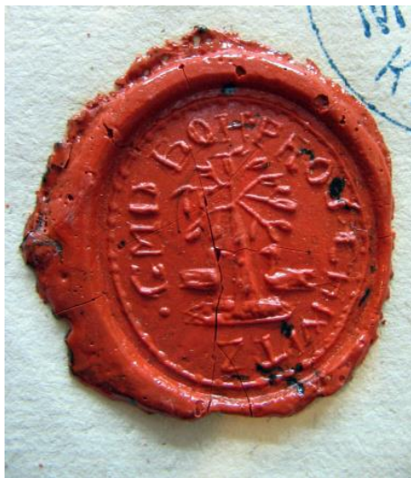
Pečet' obce České Proseče