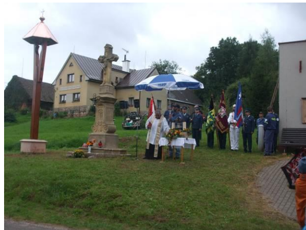
Obnovení zvoničky v Úbislavicích 2012