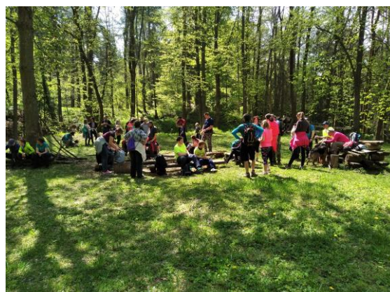
Květnový výlet se Sokolem